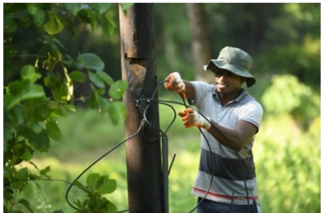
වීදුලි වැට අළුත්වැඩියා කිරීම