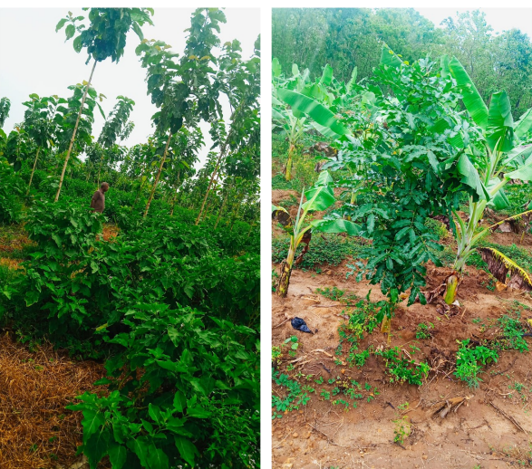
කෘෂි වන වගා ස්ථාපනය කිරීම