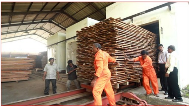
ඉරු දැව පරිරක්ෂණය කිරීමේ, පදම් කිරීමේ සහ වියලීමේ කටයුතු