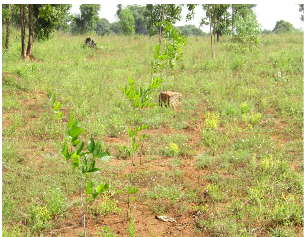
වනාන්තර මැන මායිම් නිරූපණය කර සංරක්ෂිත හෝ රක්ෂිත වනාන්තර ලෙස ප්‍රකාශයට පත් කිරීම