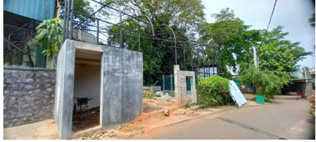
දෙහිවල සත්වෝද්‍යානයේ මැකෝ ගිරවුන් සඳහා