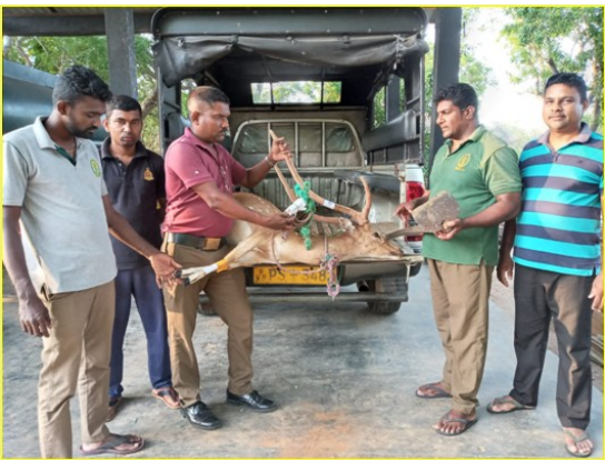
වනජීවී නීතිය ක්‍රියාත්මක කිරීම