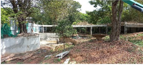
දෙහිවල සත්වෝද්‍යානයේ සිංහ අරණ අළුත්වැඩියා කටයුතු