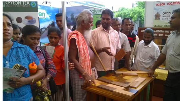
දැව සම්බන්ධ තොරතුරු ඇතුළත් මුද්‍රිත ප්‍රකාශයට පත්කිරීමේ කටයුතු සහ දැනුවත් කිරීමේ කටයුතු සිදුකිරීම.