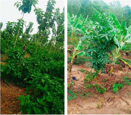
விவசாய வனச் செய்கையை நிறுவுதல்