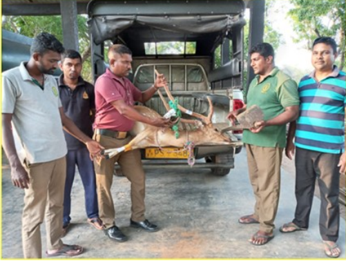
வனவிலங்கு சட்டத்தைச் செயற்படுத்தல்