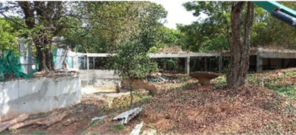
தெறிவளைமிருகக்காட்சிசாலையில் சிங்க ஒதுக்கிடத்துக்கான புனர்நிர்மாண நடவடிக்கைகள்