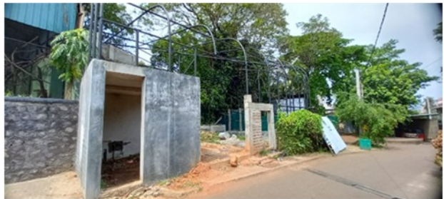
தெறிவளை மிருகக்காட்சிசாலையில் மெக்கோ கிளிகளுக்கான ஒதுக்கிடம்