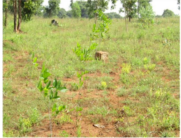
காடுகளை அளந்து எல்லைகளைக் காட்டி பாதுகாக்கப்பட்ட அல்லது ஒதுக்கப்பட்ட